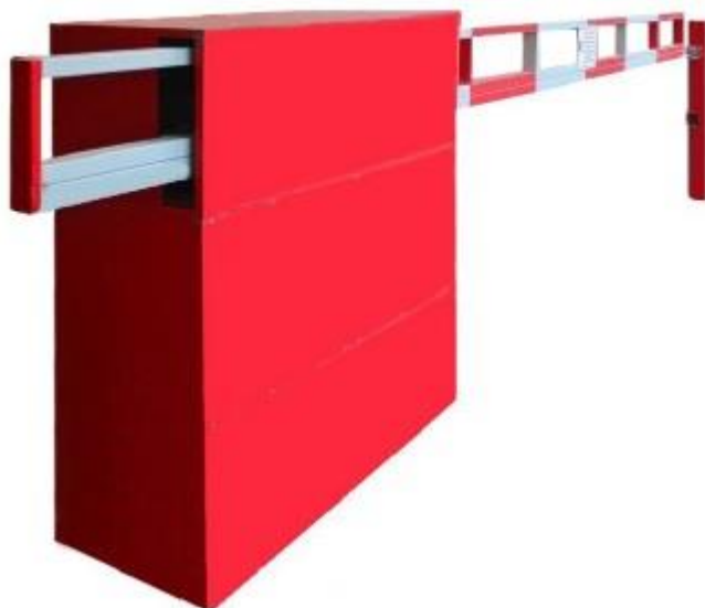
Рис. 2. Внешний вид шлагбаума

Тумба шлагбаума (см. рисунок 2) в комплекте с направляющими роликами, размер 1250*500*1250мм.