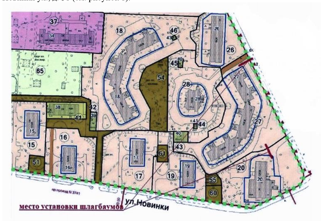
Рис. 1 Схема размещения шлагбаумов

1.1. Место размещения шлагбаумов: город Москва, Кленовый бульвар, д. 26 и Новинки ул., д. 31 (см. рисунок 1).